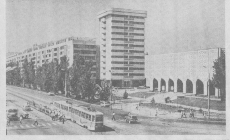
ТАШКЕНТ СЕГОДНЯ. Хорошеет и благоустривается столица республики. За последние время в городе построено много прекрасных жилых домов, административных зданий, культурно-просветительных учреждений. На снимке: вид на проспект В. И. Ленина.