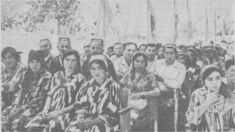
Во время беседы.