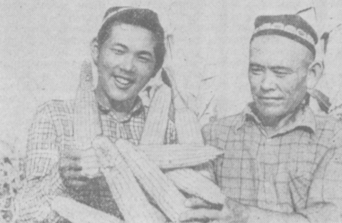
РЕШЕНИЯ ИЮЛЬСКОГО ПЛЕНУМА—В ЖИЗНЬ!