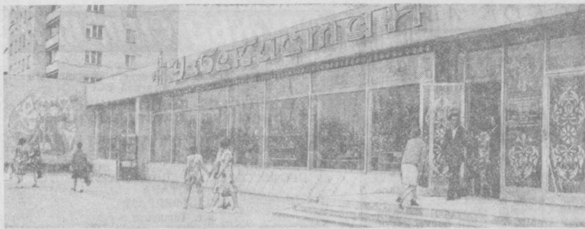
ФОТО НАШЕГО ЧИТАТЕЛЯ ИЗ ИВАНОВА