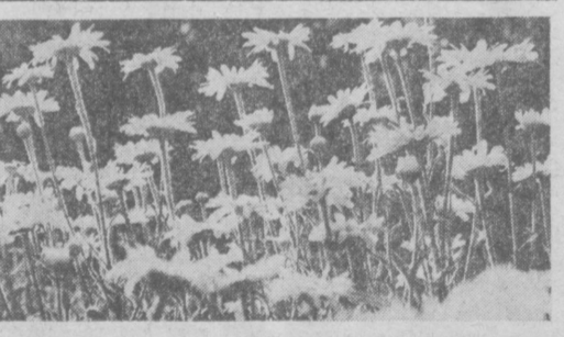
Ромашки — цветы лета.

ВСЕ смешалось в квартире Обленинских. Аппетитно пахла газовая плита, многообещающе хлопала дверца холодильника, тонкие намеки вывешивали хрусталь, выставляемый из серванта на крахмальной плато стола.