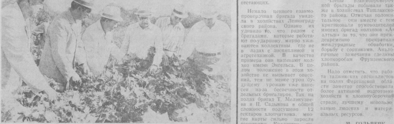
Ход выполнения социалистических обязательств, взятых туркменскими полями на третий год пятилетия, проверяют прибывшие в Узбекистан друзья по соревнованию из братских хлопководческих республик. На снимке: взаимопроверочная бригада туркменских хлопкоборов на полях колхоза «Коммунизм» Шаватского района.