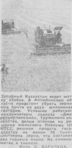
Западный Казахстан ведет жатву пшеницы. В Акмолинской области предстоит убрать зерно...