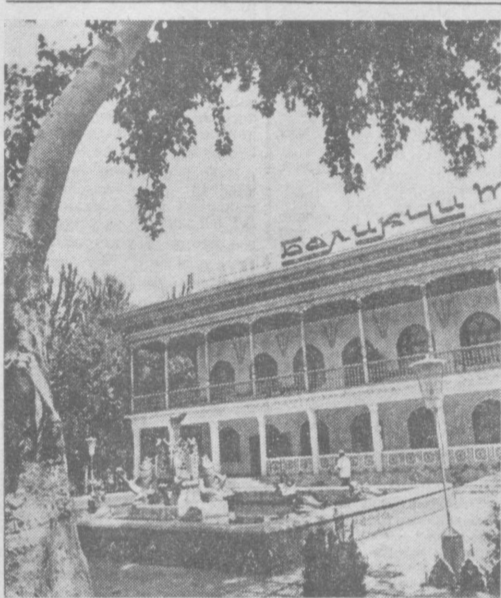
ПО УЗБЕКИСТАНУ. Новая чайхана в Балыкчи (Андижанская область).

От машиниста, от его знаний и опыта, отношения к своим прямым обязанностям зависит качество необходимой стране продукции. Все машинисты вращающихся частей нашего завода работают с момента пуска предприятия. Все — опытные, добросовестные и ответственные. Любят свою работу. Большинство из них — коммунисты. Помню и я этот особенный в моей жизни день, когда стал кандидатом в члены КПСС. Произшло это 1 апреля 1963 года. А ровно через год я, как и мои лучшие товарищи, стал членом партии. Это событие стало самой крепкой нитью, связывающей меня с родным заводом, с Ахангараном. Здесь я приобрел не только хорошую специальность, но и много друзей.