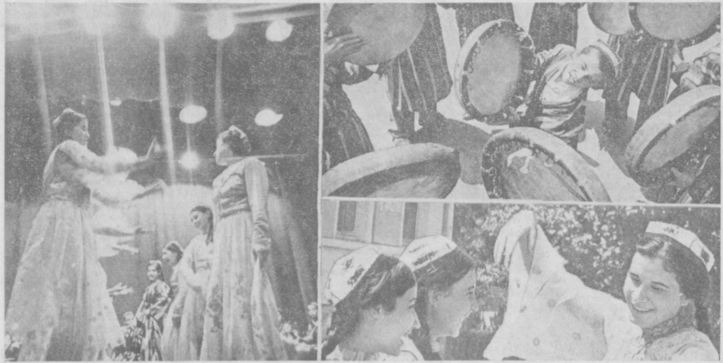
При Дворце культуры Маргиланского шелкового комбината работают около 17 кружков. В них занимаются более 700 рабочих, служащих, школьников.

РЕСПУБЛИКА ОТ КРАЯ И ДО КРАЯ С ГЛУБИНЫ 300 МЕТРОВ