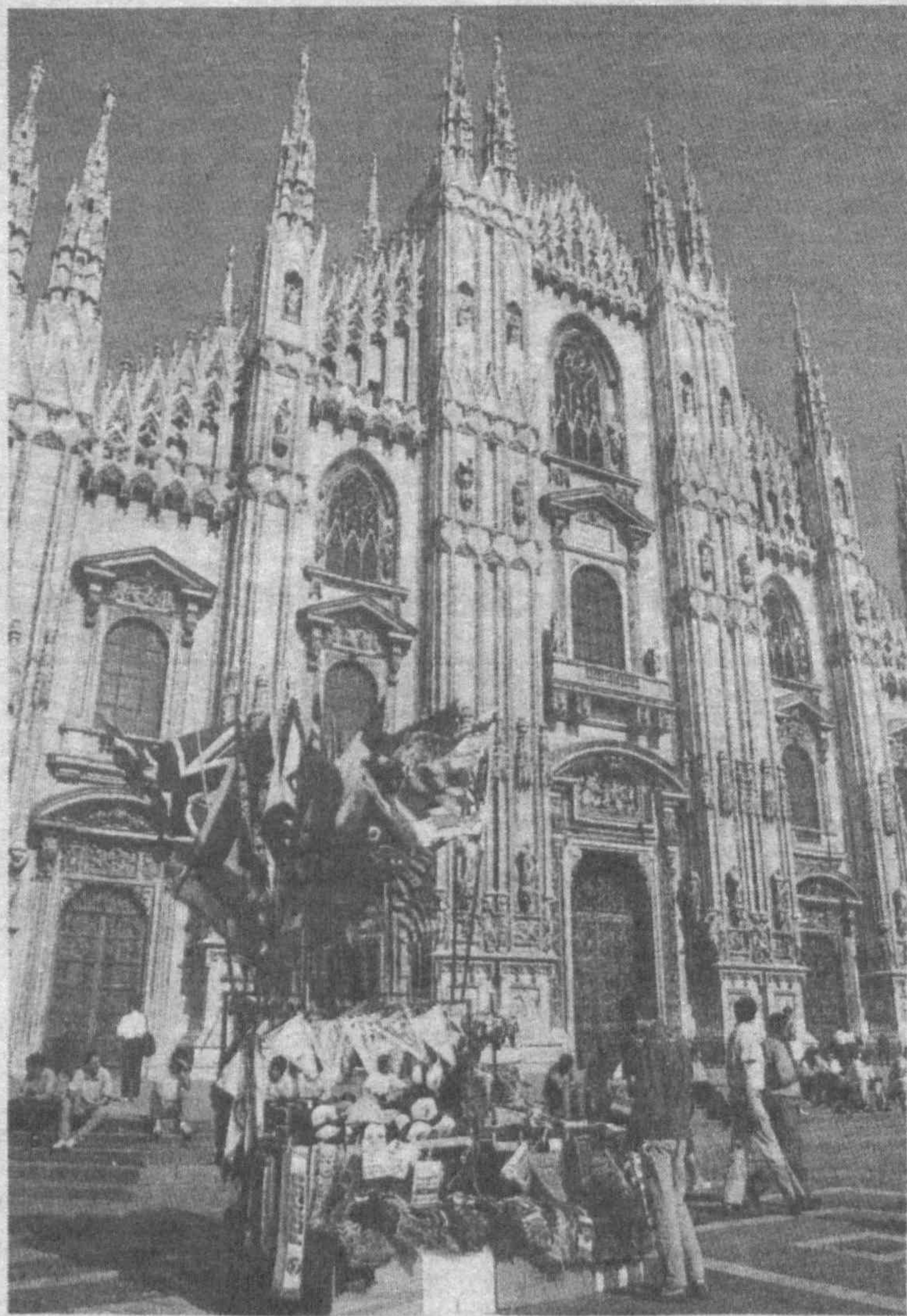
ПО СТРАНАМ МИРА. Италия. Милан. Соборная площадь.

Похороны Альфреда Шнитке состоятся в Москве.