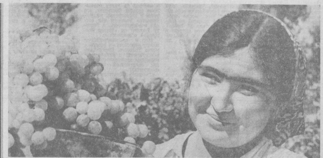
Труженики совхоза «Авангард» Бекабадского района выполняют годовой план сдачи государству винограда и яблок. Отсюда на заготовительный пункт поступило 450 тонн яблок и 58 тонн винограда. Часть продукции отправлена строителям.

С. ЗИЯДУЛЛАЕВ. Академик Академии наук Узбекиской ССР.