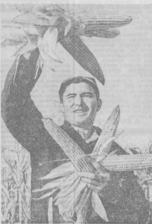
Уборку кукурузы на зерно ведут земледельцы колхоза «Молния» Кумурганского района...