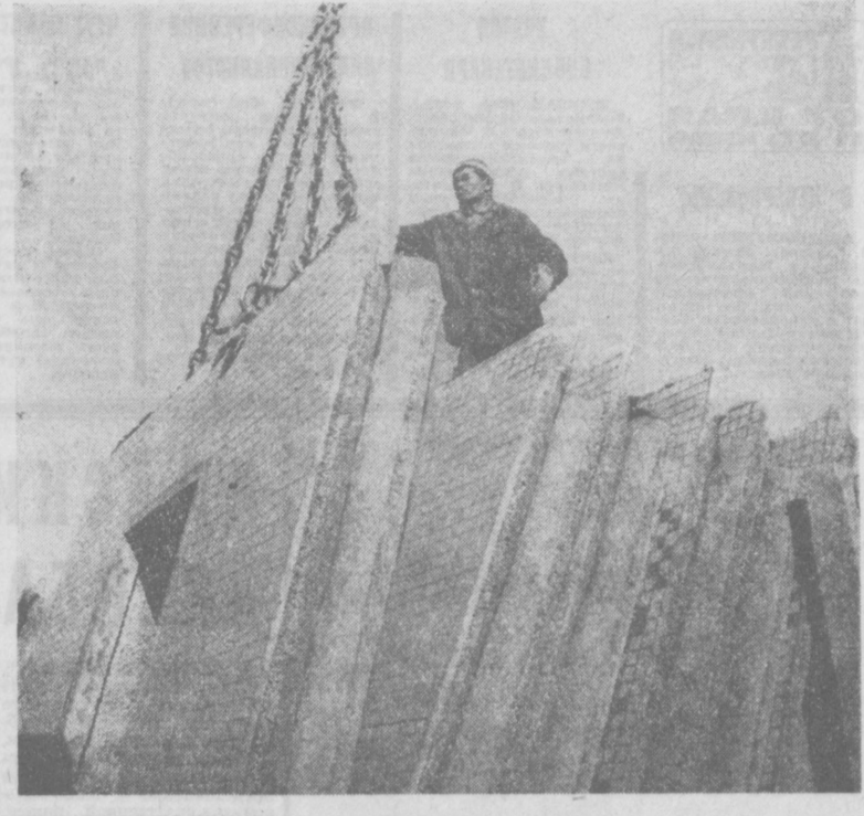
Дизайнерский комбинат строительных материалов ежегодно производит 204 тысячи кубометров продукции. Идет она на строительство домов в целинных хозяйствах Средней Азии, Узбекистана, Таджикистана, Казахстана и Джибути. Хорошую оценку строителям получили бесцементные керамзитобетонные панели, производство которых начато в нынешнем году. Они разработаны и внедрены в производство районными комбинатами. По качеству панели не уступают цементным, но по себестоимости, у них меньше объемный вес. На снимке: продукция для строек Чернышевского района.