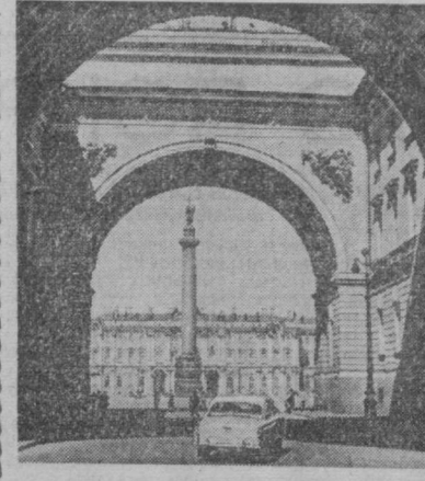
Ленинград. Арка главного штаба.

бодили город Ленина от вражеской блокады. День 27 января 1944 года был большим праздником для ленинградцев, для всех советских людей. В этот день в Москве торжественно прогремел артиллерийский салют, возвестивший миру, что вражеская блокада Ленинграда полностью ликвидирована.