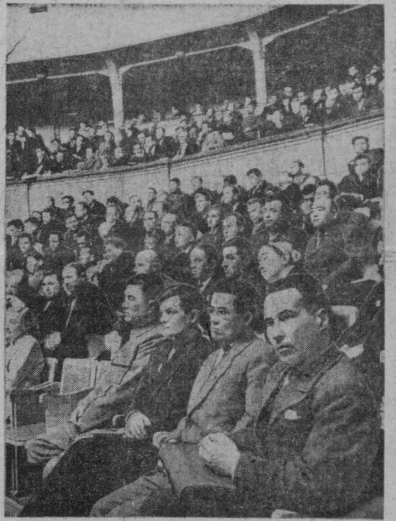
В зале совещания строителей Узбекистана.

Славная годовщина советско-румынского Договора Первый секретарь ЦК КПСС, Председатель Совета Министров СССР Н. С. Хрущев и Председатель Президиума Верховного Совета СССР Л. И. Брежнев направили Первому секретарю ЦК Румынской Рабочей Партии, Председателю Государственного Совета Румынской Народной Республики Георге Георгиу-Дежу и Председателю Совета Министров Румынской Народной Республики и Иону Георге Мауреру телеграмму, в которой от имени Центрального Комитета КПСС, Президиума Верховного Совета СССР, Совета Министров СССР и всего советского народа сердечно поздравляют румынских руководителей и братский румынский народ с 16-й годовщиной со дня подписания Договора о дружбе, сотрудничестве и взаимной помощи между Советским Союзом и Румынской Народной Республикой. (ТАСС).