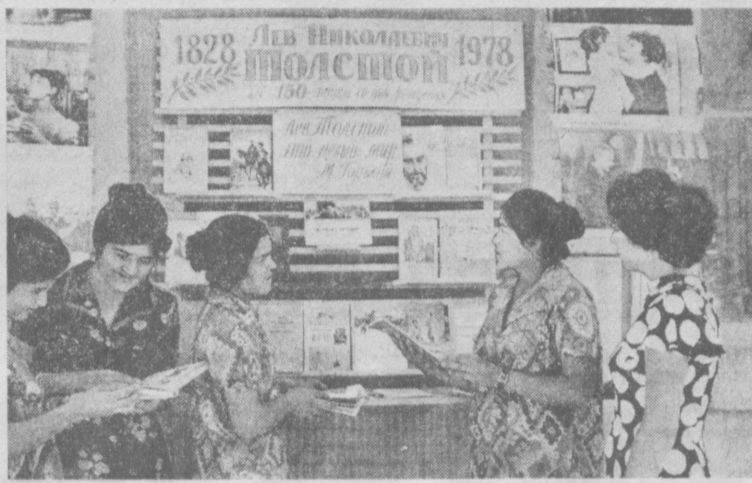
К 150-летию со дня рождения Л. Н. Толстого