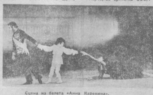
Сцена из балета «Анна Каренина».