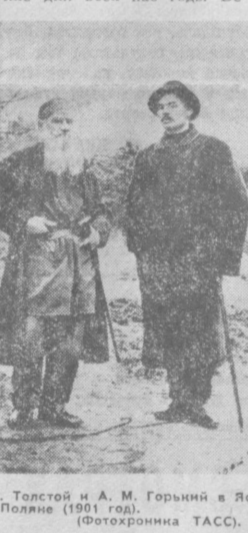
Л. Н. Толстой и А. М. Горький в Ясной Поляне (1901 год).

Насколько беднее были бы наши представления об истории без высокохудожественных образов романа, рисующих красоту народного подвига в войне 1812 года! Мы особенно ясно ощущали это, с новым чувством перечитывая роман в тяжкие для всех нас годы Ве-