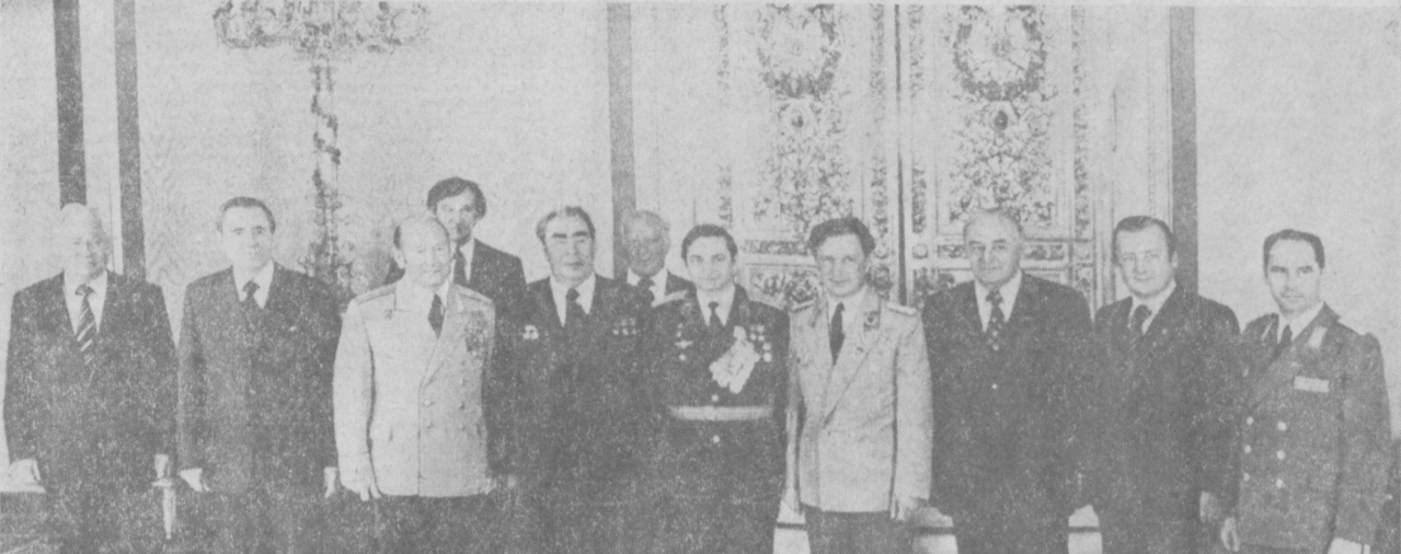
При вручении наград.