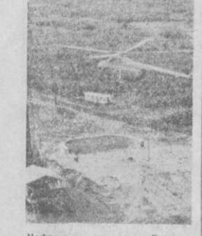
Нефтяные резервы Татарии. Вертолет доставляет вату на отдаленное Бонджоевское месторождение управления «Прикамнефть».