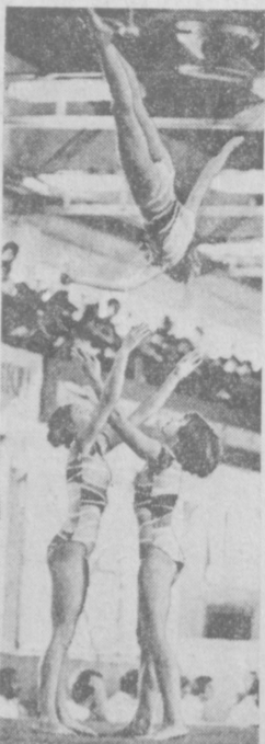
На снимках успешно выступили в первый день соревнований акробаты Украины...