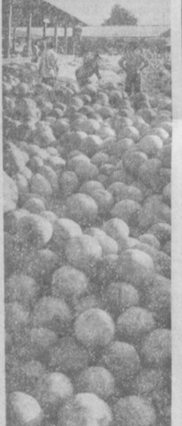
Наполненные солнцем, даря покой и радость рынку наших городов. На снимке: торговля арбузами на Алайском рынке в Ташкенте.