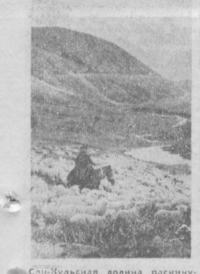
Сон-Кульская долина раскинулась на высоте более трех тысяч метров над уровнем моря. Четверть миллиона овец кормит ее пастбища. Хороший водосборный бассейн, удобные водопой позволяют увеличить вес каждого животного в среднем на 12—15 килограммов. На снимке: отара овец колхоза «Ташкент» Кочкорского района (Киргизия) в пути на пастбище «Сон-Куль».