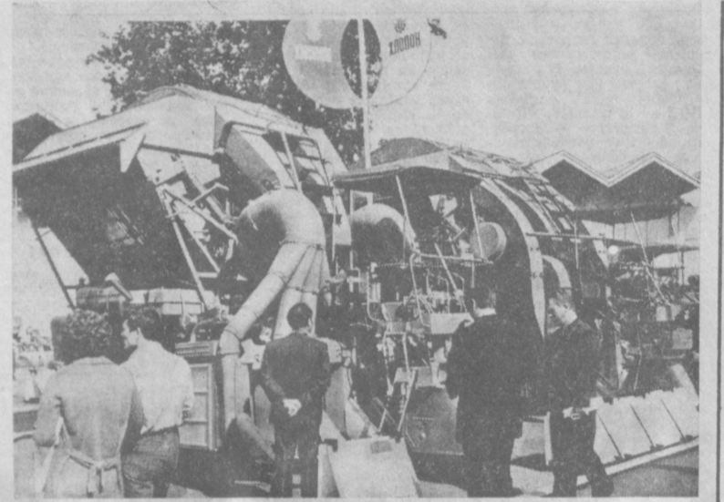
Большим успехом у посетителей международной выставки «Сельхозтехника-78» в Москве пользовалась хлопкоуборочная техника, которую выпускает «Ташсельмаш». На снимке: посетители выставки у хлопкоуборочных машин.