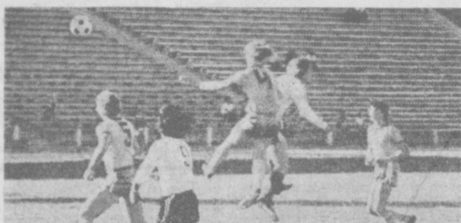
В остром поединке борются футболисты (снимок справа). В первый день состоялся забег на 100 метров (снимок слева) и прыжки в длину (снимок справа).