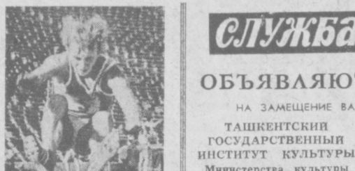
В остром поединке борются футболисты (снимок справа). В первый день состоялся забег на 100 метров (снимок слева) и прыжки в длину (снимок справа).