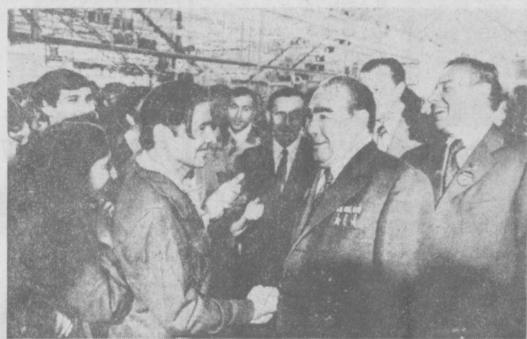
Эти снимки сделаны вчера в Баку, куда для участия в торжествах по случаю вручения городу ордена Ленина 20 сентября прибыл Генеральный секретарь ЦК КПСС, Председатель Президиума Верховного Совета СССР Л. И. Брежнев. На снимках: слева — возложение венка к памятнику В. И. Ленину на площади Ленина; справа — во время посещения зазора бытовых кондиционеров.