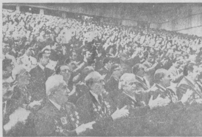
На снимках: во время торжественного заседания. На трибуне Л. И. Брежнев.

Торжественное заседание открыл первый секретарь