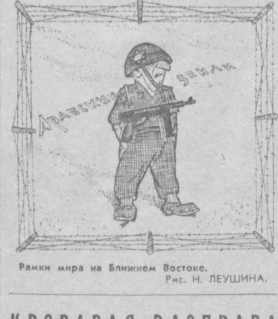
Рамки мира на Ближнем Востоке. Рис Н. ЛЕУШИНА.

Широкий оппозиционный фронт Никарагуа выступил с заявлением, в котором разоблачаются злодеяния кровавого режима. Самоса характеризуется в нем как военный преступник, которому не избежать народного возмездия. (ТАСС. 22 сентября).