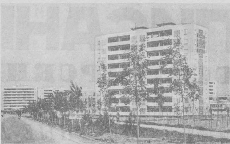
ТАШКЕНТ СЕГОДНЯ. Новые многоэтажные жилые дома на массиве Ташкентского медицинского института.

Н. ВАСИЛЬЕВ. Соб. корр. «Правды Востока», Октябрьский район.