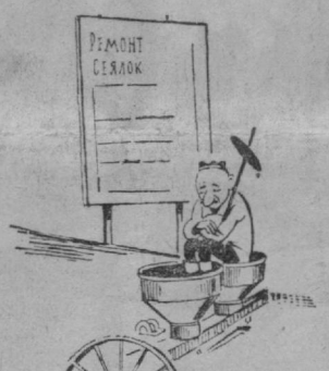
Приятен отдых под дождем. С ремонтом малость подождет. Возречем, на сеялку присев, еще не скоро будет сева.

Весна не за горами. Недалек день сева. И сеялки — на линейку готовности!