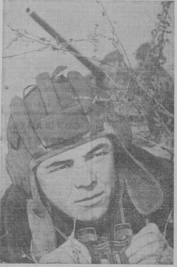
Таким было это зимнее утро. Но поезда в зрелищных местах часто задерживаются. Так случилось и на этот раз. Когда воины пришли на танкодром, из-за гор подул порывистый ветер, перебивший вскоре в песчаный бурян. И все же танкисты наладили стрелять: надо уметь поражать цели в любых условиях.

П. СТЕПАНОВ. Корр. газеты «Ленинское знамя». Кавказский военный округ.