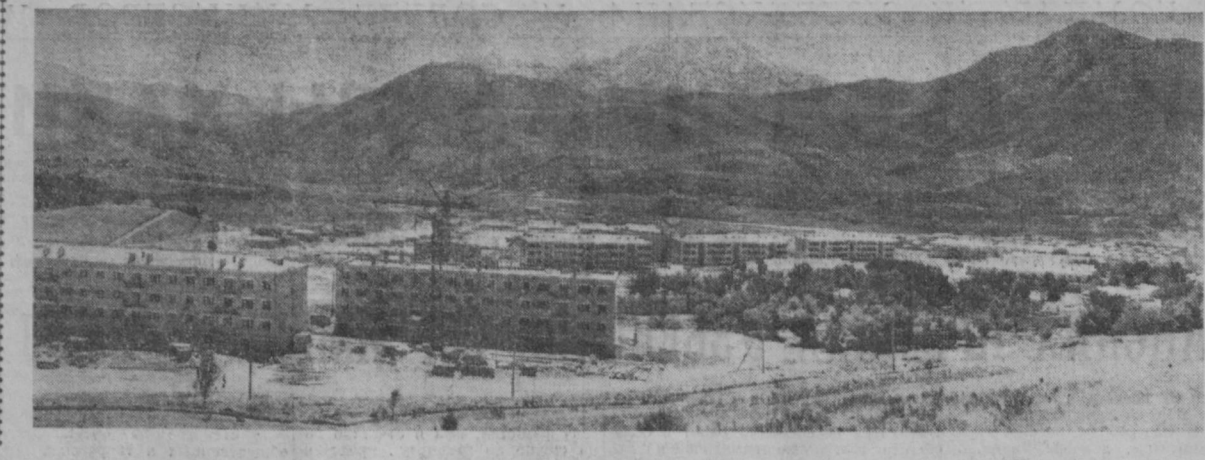
Это — вид на поселок Чарвакэстроля. Он растет с каждым днем. Накануне Дня строителя здесь дано в эксплуатацию еще несколько жилых домов и культурно-бытовых объектов.

Они еще не знают друг друга. Прислонившись к стене, просматривают вместе учебники. — И перед смертью можно надеяться, — улыбается один.