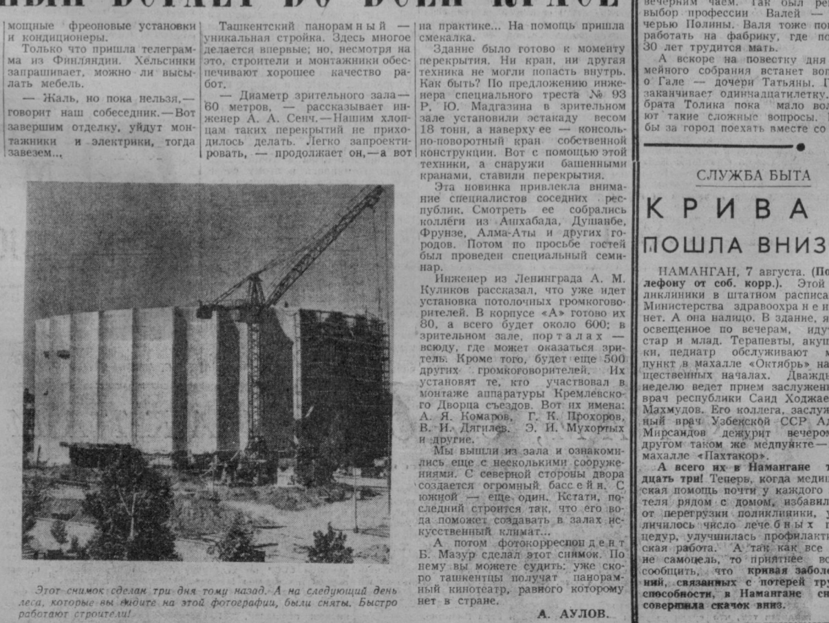
Этот снимок сделан три дня тому назад. А на следующий день леса, которые вы видите на этой фотографии, были сняты. Быстро работают строители!

С каждым днем все меньше остается лесов на здании Ташкентского панорамного кинотеатра. Идет отсюда внешняя сторона.