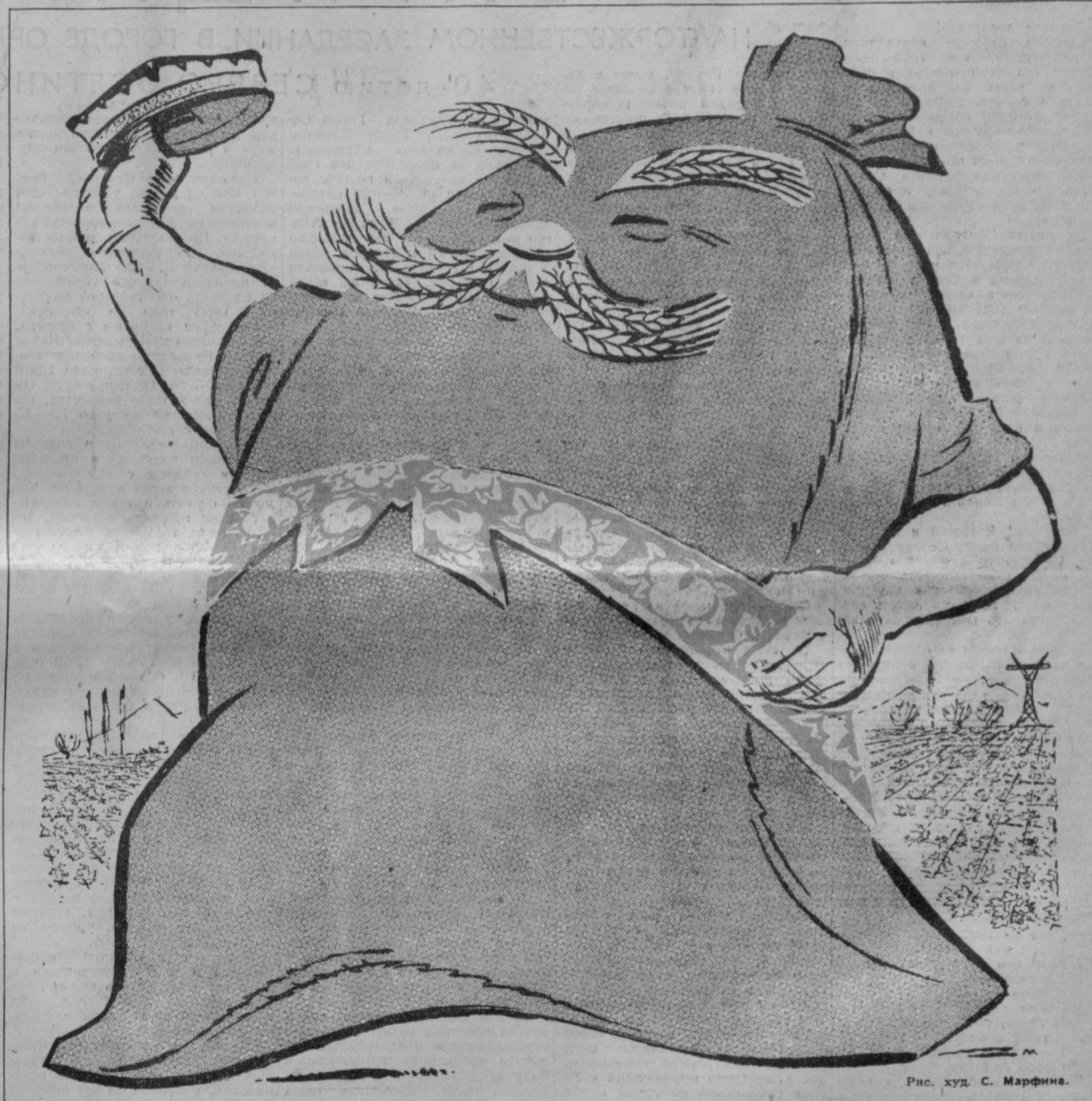
Рис. худ. С. Марфина.