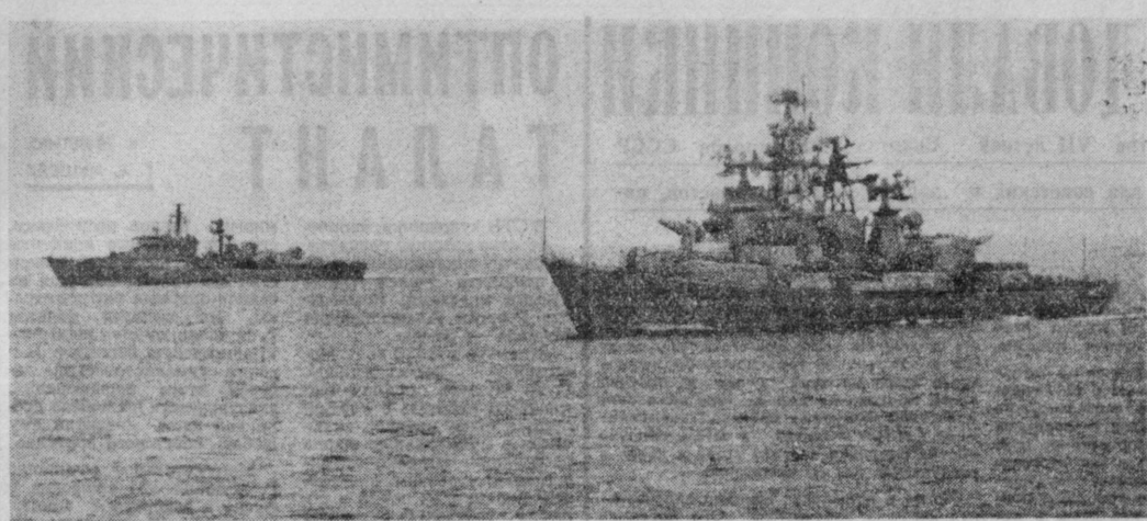
Боевая учеба Краснознаменного Черноморского флота. Большие противолодочные корабли в походе.

Комиссия заслушала информацию председателя Комитета советских женщин В. В. Николаевой-Терешковой о подготовке к всемирной конференции «За мирное и счастливое будущее для всех детей», которая состоится в сентябре в Москве. (ТАСС).