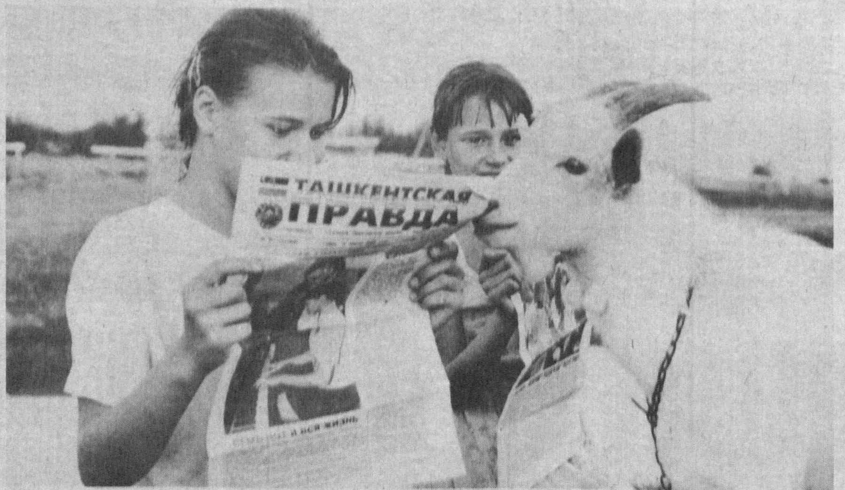
И козлу понятно: выписывать надо «Ташкентскую правду».

Наверное, мораль в этом случае будет выглядеть очень банальной. Спор в семейной жизни все равно не избежать, проблемы межличностных отношений останутся. Но вот одно все-таки надо неустанно повторять: помните, жизнь человеческая очень хрупка, и при любых обстоятельствах избегайте действовать так, как герои американских боевиков.