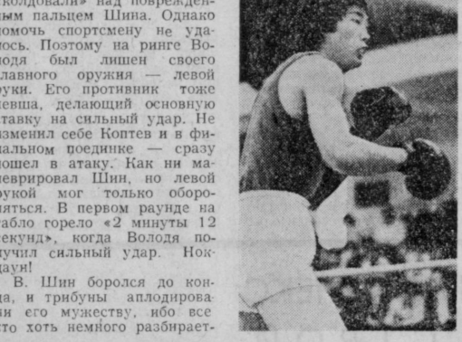
В Шин боролся до конца, и трибуны аплодировали его мужеству...