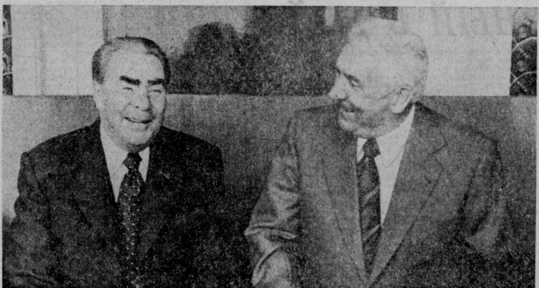
Во время встречи.

Нет более возвышенной цели, чем беззаветное служение Родине, партии, народу, делу построения коммунизма.