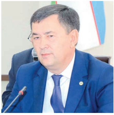
Эркинжон ТУРДИМОВ, Самарқанд вилояти ҳоқими, Олий Мажлис Сенати аъзоси