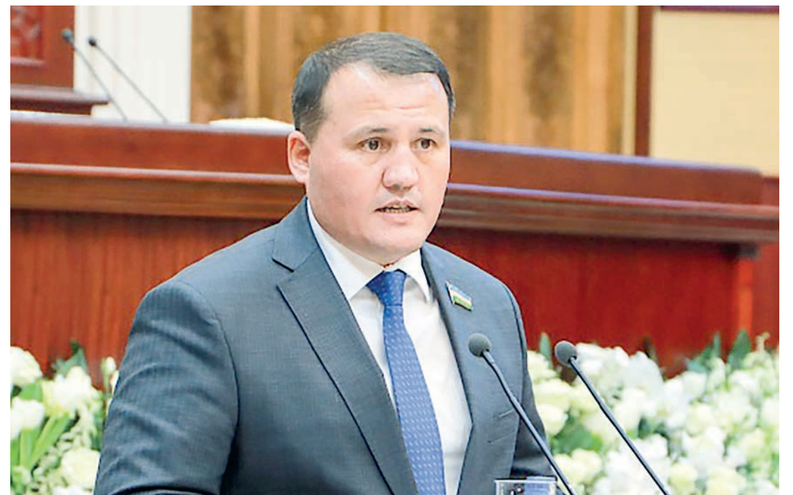
Ахтам ХАЙТОВ, O'zLiDeP Сиёсий Кенгаши Ижроия қўмитаси раиси, Олий Мажлис Қонунчилик палатаси Спикери ўринбосари