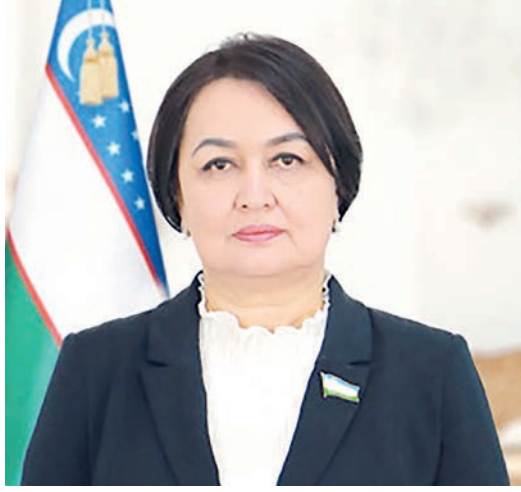
Дилором ФАЙЗИЕВА, Олий Мажлис Қонунчилик палатасининг Халқаро ишлар ва парламентлараро алоқалар кўмитаси раиси

Бугунги кун дунёдаги глобал хавф-хатарлар ва муаммолар асносида юзага келган мураккаб шароитда хавфсизлик ва барқарорликни таъминлаш учун халқаро ҳамкорликни мустақамлаш ҳаётини заруратга айланиб бормоқда. Конструктив мулоқот ва ҳар бир тарафнинг манфаатларини ҳисобга олиш ва ҳурмат қилишга асосланган кўп томонлама ҳамкорликни йўлга қўйиш билан долзарб муаммоларни ҳамжиҳатликда ҳал этиш мумкин.