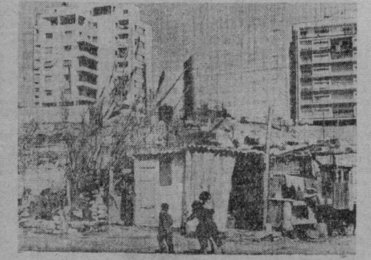
Столица Ливана Бейрут — город контрастов. Рядом с комфортабельными современными домами соседствуют покосившиеся лачуги бедняков. Один из таких уголков Бейрута показан на этом снимке.

РАНГУН, 3 июля. (ТАСС). А. И. Микояном. Делегация будет иметь встречи и беседы с председателем Революционного совета и революционного правительства Бирмы генералом Не Вином и другими руководителями деятелями страны.