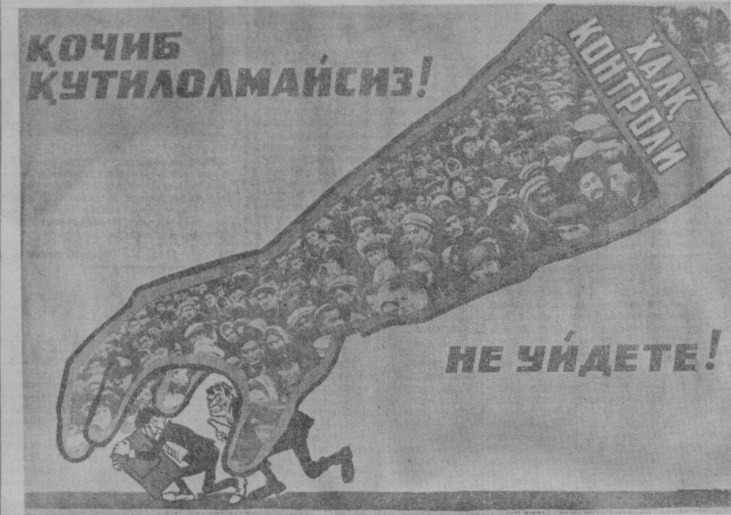
Плакат худ. Н. Леушина.

В поселке Келес, что в Калининском районе Ташкентской области, более шести лет назад начал строить стадион. Поставили дувал, а затем и кирпичные ограждения. Но дальше этого дело не пошло. Стройку забросили, а материалы растащили.