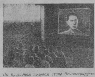
На бригадном полевоом стане демонстрирует фильм «Патеро из Ферганы».