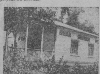
Колхозный бытовое комбчат.