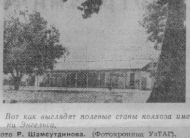
Вот как выглядят подовые станы колхоза имени Энгельса.