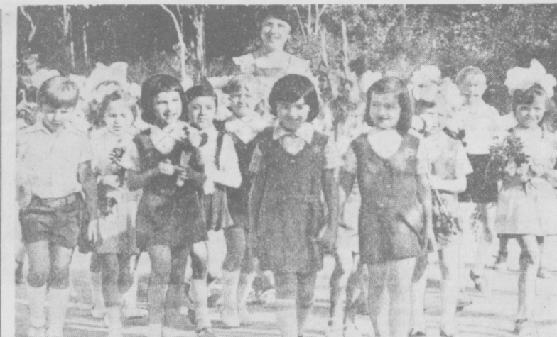
Этот снимок наш фотокорреспондент Л. Гусеннов сделал 30 августа в школе № 163 Чиланзарского района г. Ташкента. Первоклашки пришли на сбор, чтобы поздравить со школой, с ее распорядком дня, со своей пер-

ПОВЫШЕНИЕ качества продукции значительно зависит от специальности эксперта. Действительно, под руководством Торгово-промышленной палаты СССР, они принимают заявки торговых и других организаций, дают окончательное заключение о добротности изделий, которое служит юридическим документом для выяснения причинного заказчика ущерба и т. д. Своё мнение по выпуску изделий, ведомств, руководителям объединений, заводов и фабрик. Так, по данным нашего эксперта было выявлено, что качество вин, выпущенных на Красногвардейском винкомбинате, не соответствует стандартам. Вся партия — 7,000 декалитров была забракована. Соответствующее письмо мы направили в агропромышленное объединение «Узлодоовощинпром». В объединении заинтересовано отнеслись к нашим сигналам, выявили причины брака, приняли необходимые меры, о которых известил бюро экспертизы. Подобных ответов за последние полтора года мы получили 70. Это говорит о больших возможностях влияния бюро экспертизы. Предлагаю, чтобы в статье 7-й проекта после упоминания профессиональных союзов, Всесоюзного ленинского коммунистического Союза молодежи был конкретно назван ряд других общественных организаций, в том числе Торгово-промышленная палата СССР и ее звенья в республиках и областях. Г. МАРТИРОСОВ. Начальник Ферганского бюро товарных экспертиз.