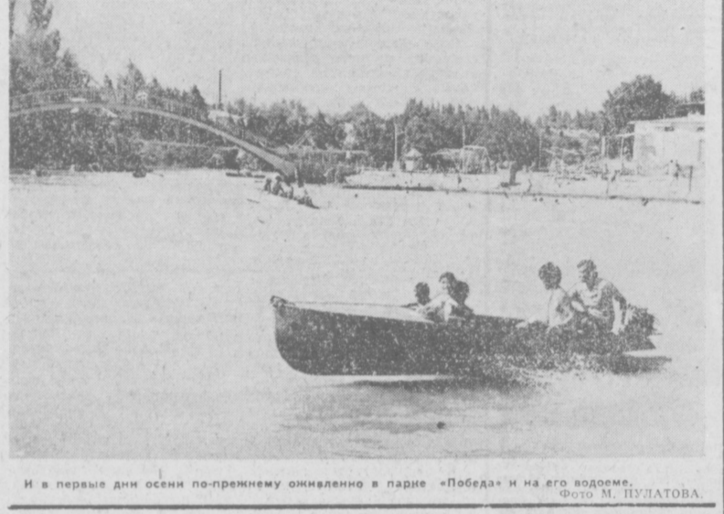
И в первые дни осени по-прежнему оживленно в парке «Победа» и на его водоеме.