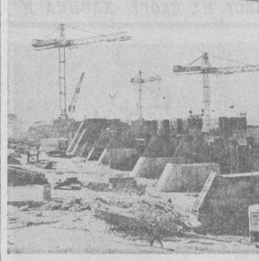
Полным ходом идет строительство Туымунского гидроузла на Аму-Дарье. С каждым днем увеличивается объем выполненных работ по укладке бетона и монтажу арматуры. С начала года в основном тело гидроузла уложено 87 тысяч кубометров бетона, а за весь период строительства — 330 тысяч кубов. На снимке: так выглядит сейчас строительная площадка гидроузла.

ный мир и что имеются резервы и возможности для повышения эффективности ООН, которая может быть обеспечена лишь на основе строгого соблюдения всеми государствами — членами организации ее Устава.