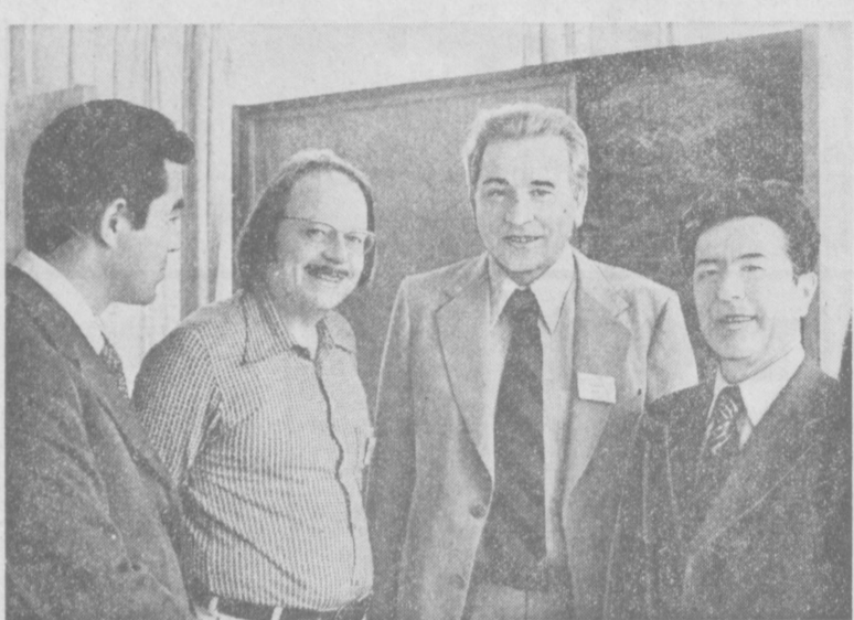
В Ташкенте проходит советско-французский симпозиум по проблемам, касающимся физико-химических основ жизни...