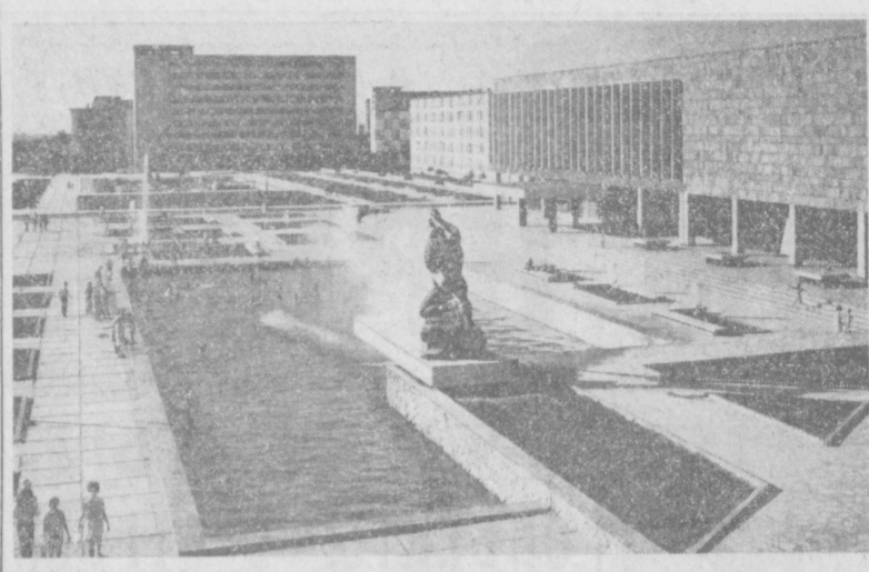
по ГОРОДАМ УЗБЕКИСТАНА. Расст и благоустройства. Навон. На снимке: площадь у Дворца химиков.