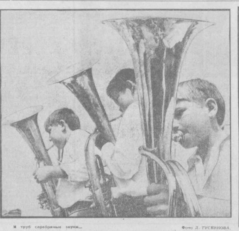
И труб серебряные зауми...

ВЗГЛЯД ПОД „КРЫШУ МИРА“ СЛЕДИМ ЗА СОБЫТИЕМ Сейчас усилия участников эксперимента в основном сосредоточены на западной границе Памира, на участке Юканд — Гарм — Калахум — Хорой — Ишаним — Мердан — Исламбад. Продолжается уточнение данных по профилю Узген — Каракуль — Зоркуль. Еще раз подтверждается актуальность задачи в регионе. Это представляет огромный научный интерес хотя бы потому, что выявленная сейсмическая активность недр малоизученной зоны простирается на тысячи километров от Тянь-Шаня до Индостанского подножья. Надо отметить, что впервые в мировой практике удалось создать единую