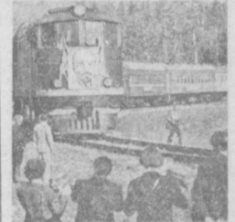
На год собрать сrons пуска поезда и Байкалу — такая задача стоит перед строителями сооружающего западного участка БАМа. Уже на 170 километрах уложены рельсы главного пути. На месад, крайнее срона прошёл первый поезд от станции Небель до станции Киренга. На снимке: первый пассажирский поезд на участке Небель — Киренга.