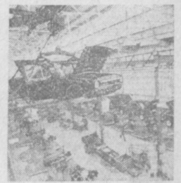
Коллектив Горьковского автозавода в честь юбилея Октябрьской революции решил изготовить сверхплана 700 грузовых и легковых автомобилей, освоить производство еще трех машин — ГАЗ-52-08, ГАЗ-59-09 и ГАЗ-24-07 (танки), работавших на газовом топливе. Вести в строй и освоить 27 автоматических и 10 комплексно-автоматизированных линий. На снимке: конвейер сборки легковых автомобилей ГАЗ-24.