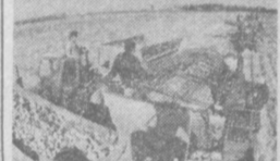
Совхоз «Луговской» известен в Приморье как передовое мартофельное хозяйство. Засеянные ежегодно получают стабильные урожаи. Началась уборка клубней. В поле выведены 18 специальных агрегатов. На снимке: механизированная уборка картофеля.