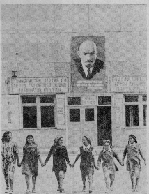
В колхозе имени Ахунбаева Учугурского района построена новая школа. С первым звонком в ее просторных светлых классах начнут занятия более семистот школьников...