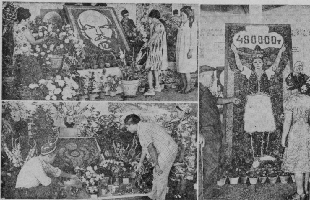
На снимках: сверху — стенд живых цветов Наманганского комбината зеленого хозяйства. В центре — изображение В. И. Ленина. Автор — агроном С. Уразов; внизу — стенд цветов Анджанского комбината зеленого хозяйства. В центре — панно, на котором изображена эмблема Международного года ребенка; справа — панно «480.000 тонн наманганского хлопка». Автор — известный цветовод республики С. Фарраджев.