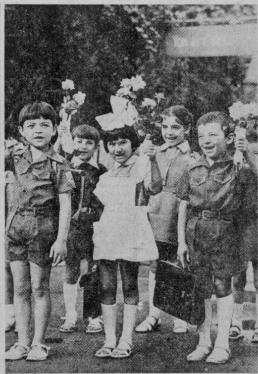
Вчера начался учебный год в вузах, техникумах и школах страны. Миллионы юношей и девушек заполнили аудитории, учебные кабинеты. Отдохнув за лето, пришла в свои учебные заведения и молодежь нашей республики. ВЕРХНИЙ РАЙОН — В ПЕРВЫЙ КЛАСС. На снимке: воспитанники подготовительной группы детского сада № 426 Куйбышевского района г. Ташкента.

В этой связи предстоит поднять на новую ступень всю политико-воспитательную работу в коллективах, программа которой дана в постановлении ЦК КПСС «О дальнейшем улучшении идеологической, политико-воспитательной работы».