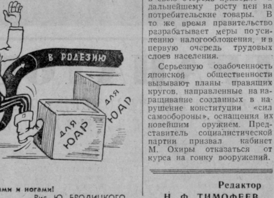
Мы за санкции руками и ногами!