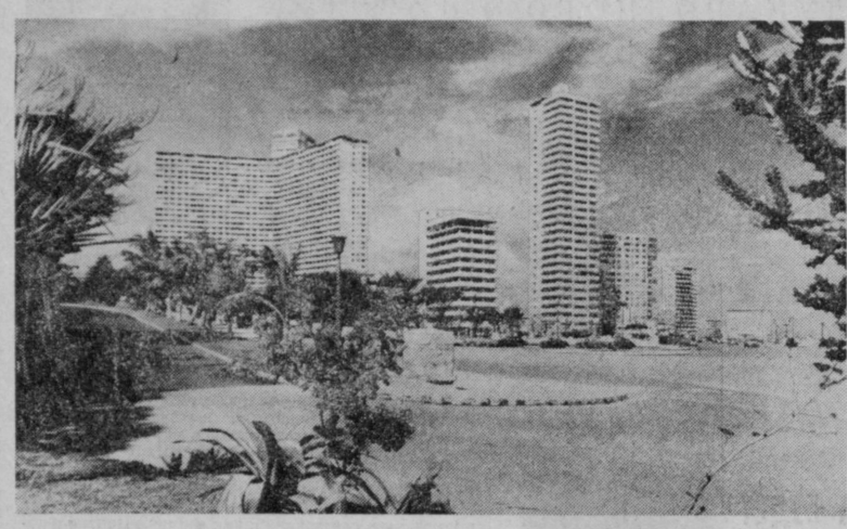
В этом живописном районе Гаваны проходит конференция глав государств и правительств неприсоединившихся стран.