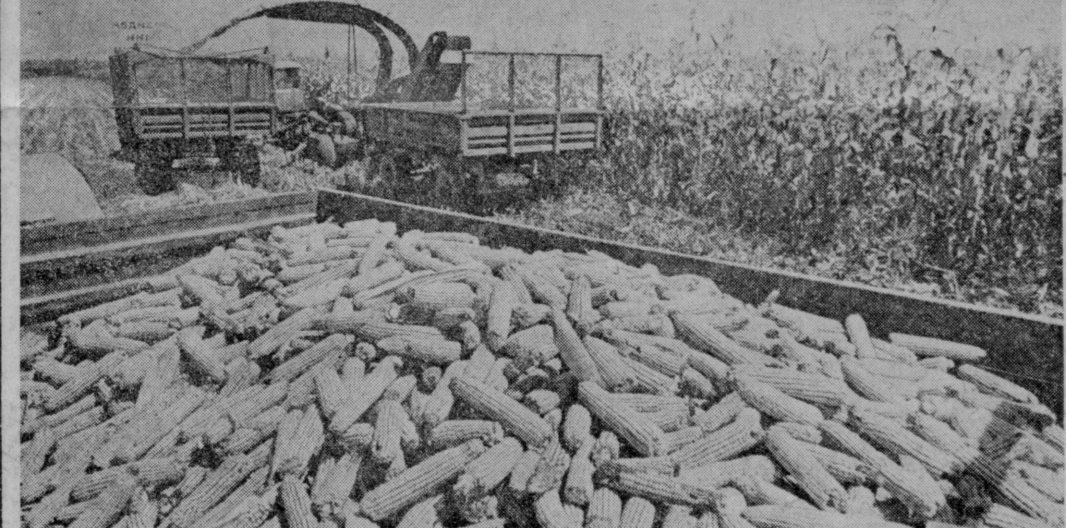
Члены бригады В. Нама из колхоза имени Ахунбаева Среднеиринского района обязались убрать урону кукурузы на 30 гектарах за десять рабочих дней. По наметкам специалистов, с гектара будет снято по 80 центнеров зерна. На снимке: идет уборка кукурузы.

Они должны уметь ясно и доходчиво довести до людей смысл стоящих перед ними задач и наилучшие пути их решения.