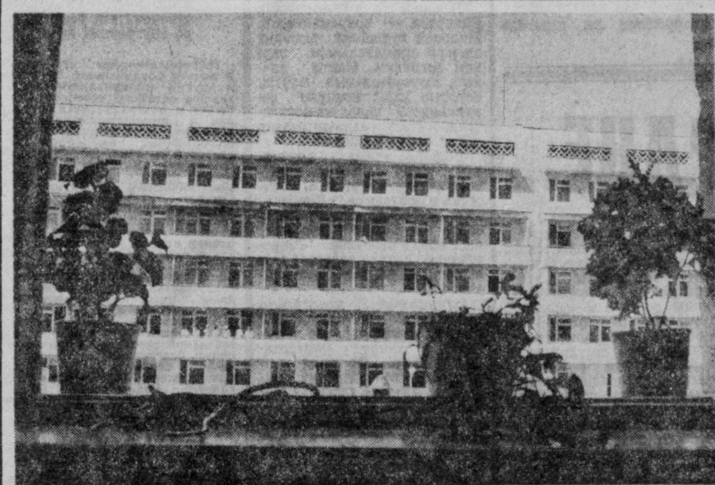
Из фонда, заработанного ташкентцами в день коммунистического субботника, на строительство и оборудование двух корпусов комплекса городской кинематографической больницы № 1 израсходовано более 11 миллионов рублей. Недавно сдан в эксплуатацию второй корпус, рассчитанный на 1500 коек. В нем размещены кардиологическое, родильное, хирургическое и пульмонологическое отделения, в которых работают 150 человек, среди которых 50 докторов и кандидатов медицинских наук. Больница стала одной из крупнейших в Средней Азии. На снимке: новый корпус больницы-киоска.

В. КАРИМОВ. Соб. корр. «Правды Востока». г. Самарканд.