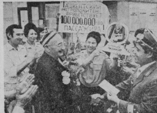
Вчера в торжественной обстановке работники Ташкентского метрополитена поздравили своего столетилетнего пассажира...