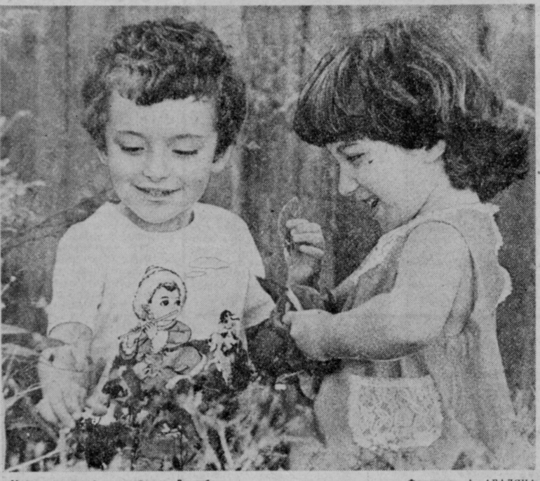
Международный год ребенка. Дружба.