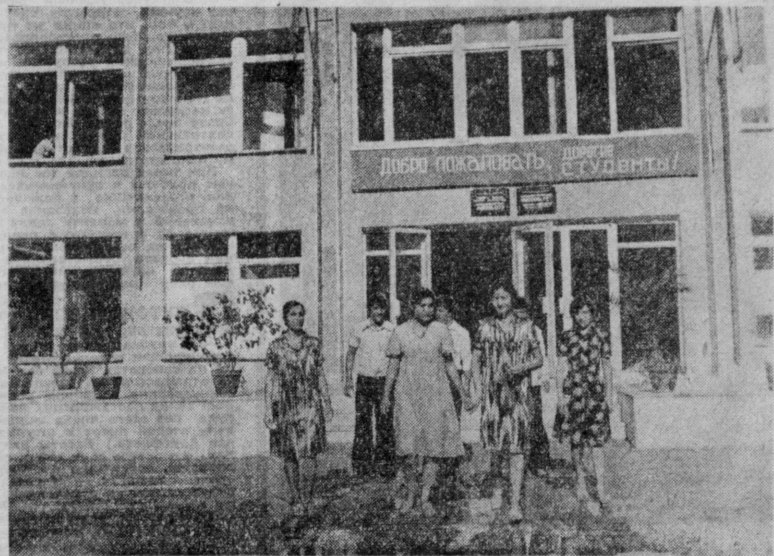
Комплексный факультет Ташкентского государственного института культуры образован в Намангане. Здесь студенты и аспиранты могут приобрести высшее образование по специальности библиотечника, библиографа, методиста-организатора культурно-просветительных учреждений а также режиссера народных театров. В настоящее время на факультете обучается 200 студентов, приехавших из городов и поселков Ферганской долины. На снимке: общий вид института.

комплексных приемных пунктах колхозов «Москва», «Пахтакор», имени Ангелыса организовали прием заказов по телефону. И при этом дали слово: каждый заказ участника уборочной страды будет выполнен в предельно сжатый срок, с гарантией высокого качества. В распоряжение сельских служб была передана 400 специальных автомашин. В такой мастерской на колесах — приемщик, парикмахер, сапожник, фотограф. Эти машины в заранее назначенное время будут прибывать на самые отдаленные полевые станы и исполнять срочные заказы на месте, а более сложные — забирать для исполнения в централизованных предприятиях. Самаркандские бытовки объединили свои усилия с кооператорами, машины двух ведомств будут курсировать вместе, образуя «поезда комплексных услуг». А в соревнованиях внутри самой службы была застывшими выступили труженники Среднеазиатского района — премии взяли С. Ризкулова и Х. Хакимов, парикмахер И. Усманов, фотограф А. Тахидов, шофер И. Пирназаров. Они завили, что отлично обслуживают хлопководов, не допуская нарушений установленного графика и перевыполняя личные планы. Пример, достойный подражания во всех коллективах отрасли!