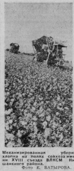
Механизированная уборка хлопка на полях совхоза имени XVIII съезда ВЛКСМ Ишанского района.