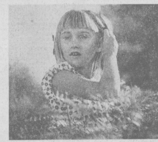
Ох, уж эти непоскорные пряди! Скажу тебе по секрету...

О том, что с 1 сентября в нашей стране проводится операция «Пешеход», знают все или почти все. Во всяком случае такое создается впечатление. Об этом говорят на улицах, пишут в газетах да и телевизионные вещают о том же. Своим размахом кампания вполне соответствует тем проблемам, которые она призвана решить. Мы привыкли к тому, что месячные безопасности движения касаются водителей транспортных средств. Они проводятся ежегодно и к ним уже привыкли. Нынешняя операция посвящена пешеходам. Это естественно. Пешеходы — самая многочисленная категория участников дорожного движения. По количеству правонарушений она также не уступает никому первому. Достаточно привести такую цифру: с начала 1977 года