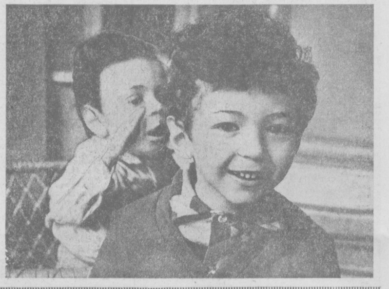
Ох, уж эти непоскорные пряди! Фотохуд Л. ГУСЕИНОВА. Скажу тебе по секрету... Фотохуд И. ГЛАУБЕРЗОНА.

движения со стороны работников ГАИ — это лишь один из методов проходящей операции «Пешеход». Заметим, весьма эффективный. Но одним штрафами проблемы не решить. Лишь внутренняя самодисциплина, неутомительное следование законам дороги помогут нам избежать многих несчастий, сделать наши улицы по-настоящему безопасными. В. ЛЕБЕДЕВ, студент У курса факультета журналистики Ташкентского государственного университета.