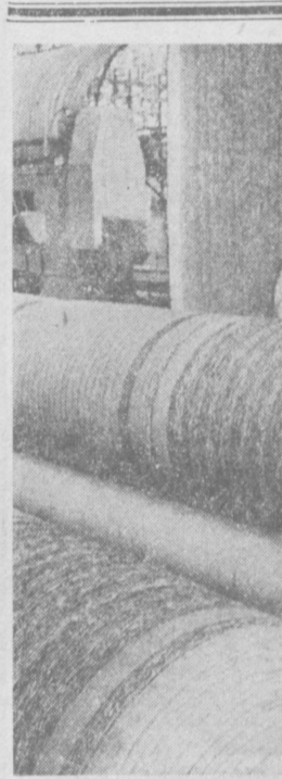
Во втором году десятой пятилетки в Ахангаране сдано в эксплуатацию новое предприятие — новорва фабрика. До конца года она изготовит миллион квадратных метров ковров и ковровых дорожек. Молодой коллектив быстро освоил весь процесс производства и выдает хорошую продукцию. На снимке: ткацкая машина, производящая ковровую дорожку.

Вот почему целесообразно в новой Конституции отразить правовое закрепление процесса возрастания роли партии и направляющей роли партии. Мне кажется, что статью 6-ю проекта следует дополнить положением: В процессе коммунистического строительства роль Коммунистической партии возрастает. Ф. ПРУДИКОВ, Кандидат философских наук, доцент.