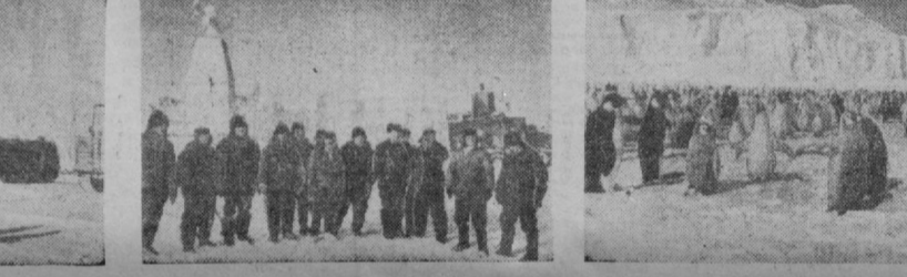
Три снимка из белоснежной Антарктиды... Первый снимок в центре ледяного купола Антарктиды, где расположена советская внутриконтинентальная южнополярная станция «Восток»; на втором снимке — на Полюсе относительной недоступности участники трансантарктического похода. Ну и, конечно, пингвин. Их фотографирует каждый, кто попадает в Антарктиду... Детский сад императорских пингвинов работает круглосуточно.