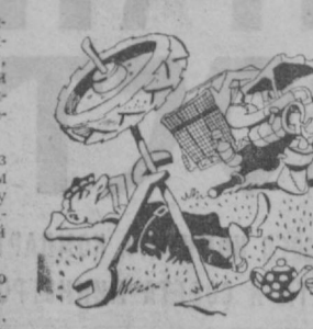
Рис. Д. Синицкого.

В минувшем году совхоз успешно справился с заданием по механизированному сбору урожая.