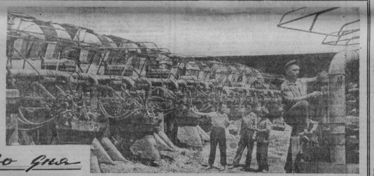
В хлопководческом совхозе имени Пятилетия Узбекской ССР Ахунбаевского производственного управления началась подготовка к уборке хлопка. Механизаторы совхоза обязались в честь 40-летия Узбекской ССР и Компартии Узбекистана отремонтировать всю хлопкоуборочную технику к 15 августа...