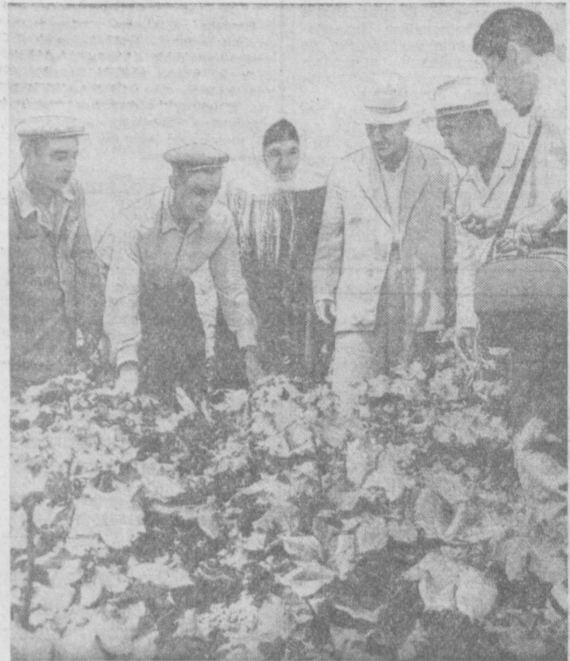
Взаимопроверочная бригада хлопководов Азербайджана на полях Ташкентской области. На снимке: азербайджанские бригады по соревнованию осматривают хлопчатник в колхозе имени XXII партсъезда Среднеазиатского производственного управления.

Уже два дня проверяют в колхозах Хорезмской области ход выполнения социалистических обязательств хлопководов Туркменской ССР. Гости с удовлетворением отмечают, что хореزمцы, преодолев трудности вышейшей неблагоприятной весны, успешно накалывают на своих полях 30-центнеровой урожай «белого золота». В июле они усилили уход за посевами. Обработка плантации ведется дифференцированно. В колхозах «Коммунизм» Гурленского производственного управления, имени Нариманова Хазараспского производственного управления, имени Кирова Янгирянского производственного управления и в других хозяйствах благодаря заботливому уходу хлопчатник вступил в фазу плодотворения. Здесь стало правилом культивацию и подкормку посевов проводить в строгом сочетании с вегетационными периодами. Вместе с тем, члены взаимопроверочной бригады вскрыли немало недостатков в организации полевых работ. Туркменские хлопководы дали дельные практические советы, которые помогут устранить недостатки.